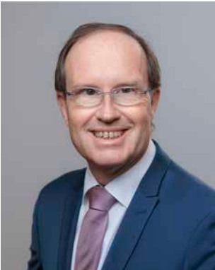
**** Utter, Tobias (CDU) Landtagsabgeordneter; geb. 1962 Bad Vilbel Wahlkreis 25 (Wetterau I)