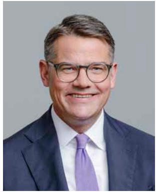
**** Rhein, Boris (CDU) Ministerpräsident; geb. 1972 Frankfurt am Main Wahlkreis 39 (Frankfurt am Main VI)