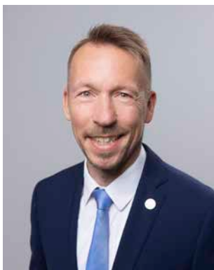
** Gaw, Dirk (AfD) Politiker; geb. 1972 Hammersbach Landesliste