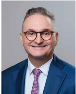
** Stirböck, Oliver (FDP) Landtagsabgeordneter; geb. 1967 Offenbach am Main Landesliste