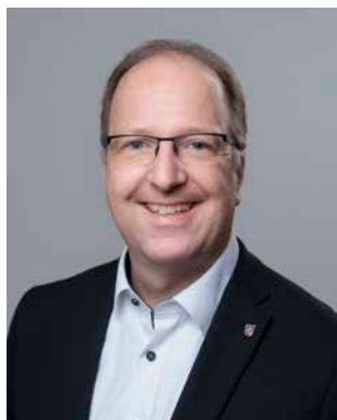
* Schon, Ingo (CDU) Ltd. Ministerialrat; geb. 1976 Eltille am Rhein Wahlkreis 28 (Rheingau-Taunus I)