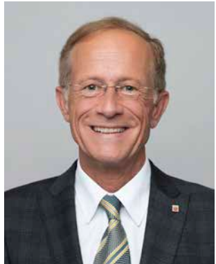
***** Wintermeyer, Axel (CDU) Staatsminister; geb. 1960 Hofheim am Taunus Wahlkreis 33 (Main-Taunus II)