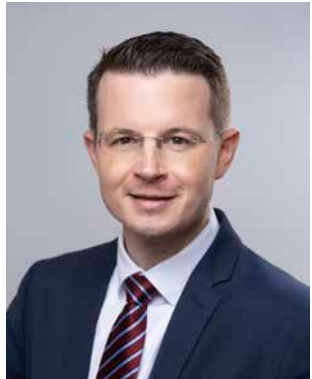
* Bausch, Roman (AfD) Fraktionsreferent; geb. 1982 Wiesbaden Landesliste