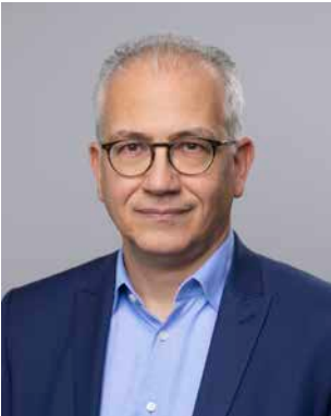
***** Al-Wazir, Tarek (GRÜNE) Staatsminister; geb. 1971 Offenbach am Main Landesliste