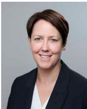
** Gersberg, Nadine (SPD) Landtagsabgeordnete; geb. 1977 Offenbach am Main Landesliste